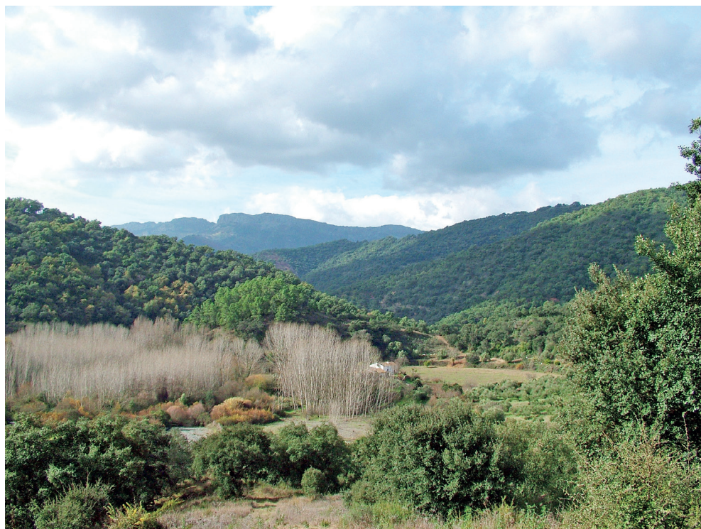
Figura 1. Vista del valle del río-arroyo Guadarrín

Para su segundo integrante habría que pensar, a nuestro juicio, en el árabe andalusí rīm ‘gamo’, más bien en su forma de singular al-rīm ‘el gamo’, con la /l/ del artículo asimilada ante consonante solar, que en su flexión de plural al-arrīm ‘los gamos’ que exigiría una construcción articulada sin asimilación. Se trataría, en consecuencia, de un Wāda l-Rīm (> Wād ar-Rīm ), un ‘rio del gamo’ o ‘río del corzo’ quizás, sin poder determinar la especie de cérvido en particular. De lo que no cabe duda es que el árabe andalusí especializó esta voz de tanta raigambre clásica para denominar esta especie de cérvido que es el gamo ( Cervus dama o Dama dama ). Lo demuestran palmariamente la