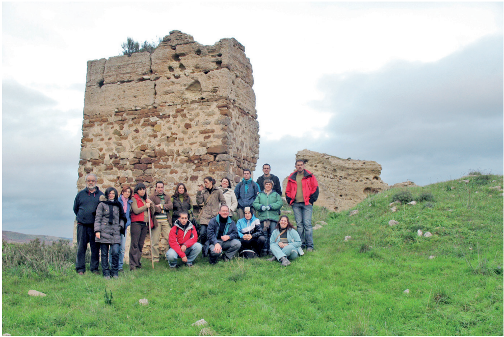
Figura 2. Castillo de Turón. Visita de estudio, curso de guías Red Patrimonio Guadalteba