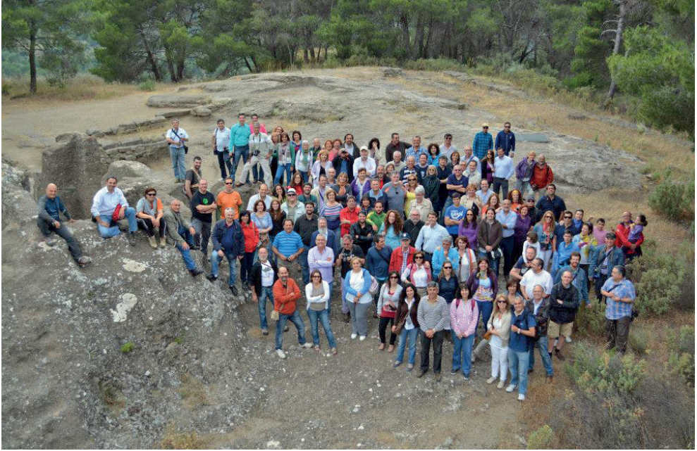
Figura 8. Junio de 2013. Bobastro. Ardales. Jornada científica: La figura de Umar ibn Hafsun a debate. Poder de convocatoria