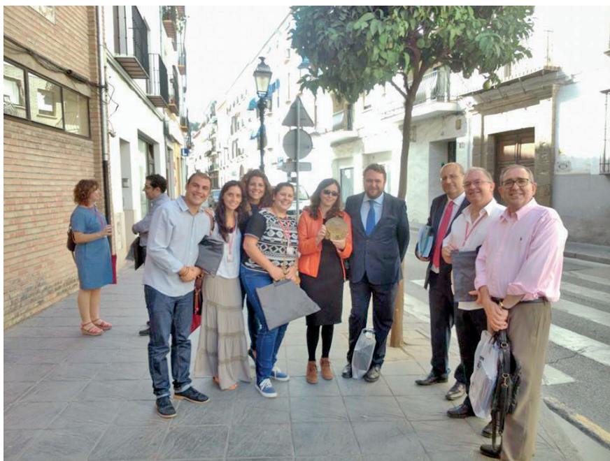
Figura 13. III Congreso Prehistoria Andalucía