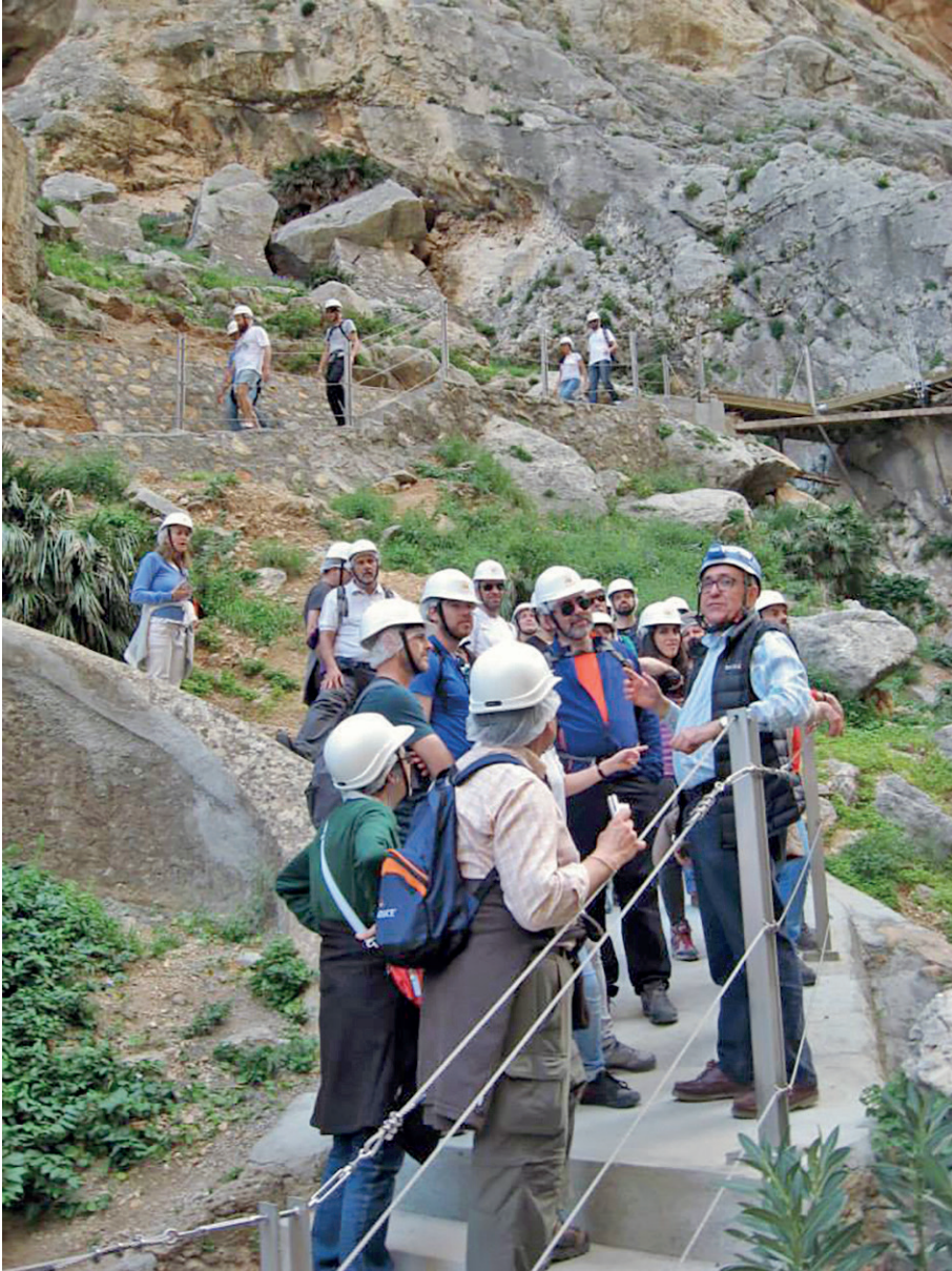
Figura 21. 2016. Abrigo de Gaitanejo. Visita por un grupo interesado al Desfiladero de los Gaitanes