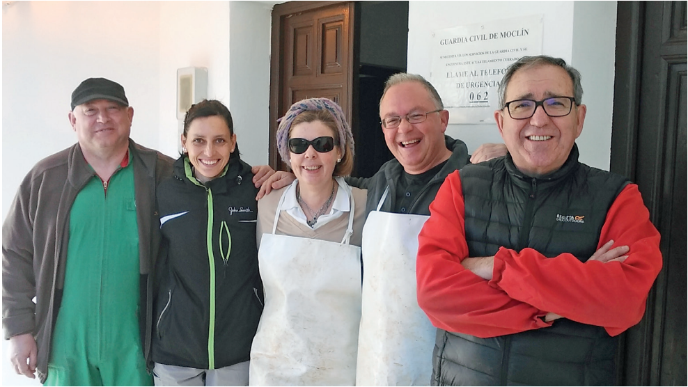
Figura 19. Moclín, Granada. Foto graciosa de la finalización del triaje de sedimentos de la cueva de Malalmuerzo