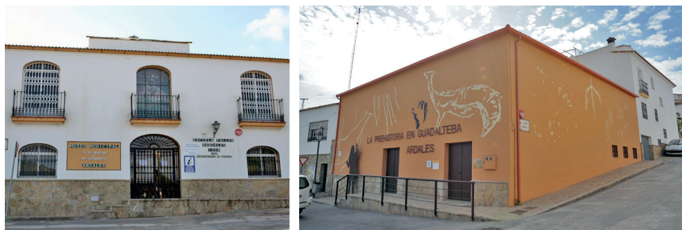
Figuras 5 y 6. El Centro antes y después de la intervención