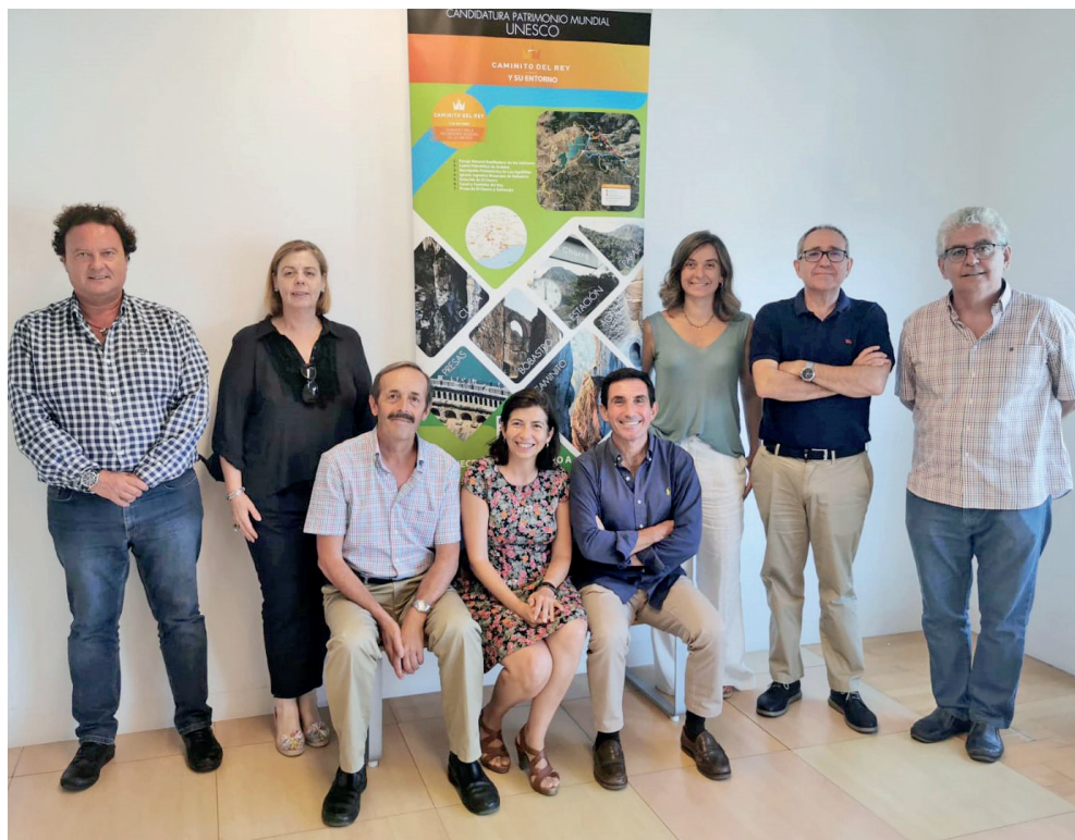
Figura 10. Comisión UNESCO