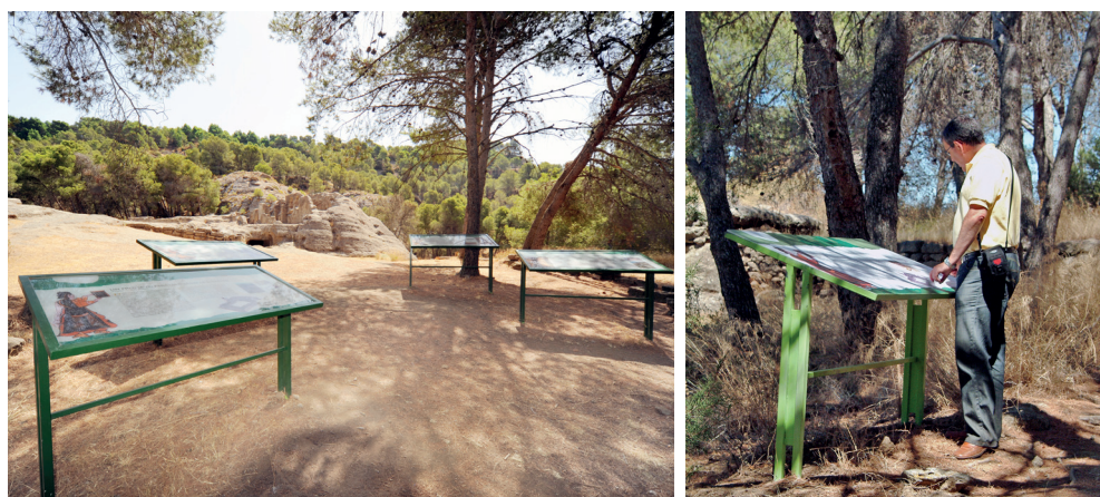
Figuras 3 y 4. Paneles interpretativos de Bobastro

para actuar, todo ello por estar Bobastro catalogado como Bien de Interés Cultural . El 5 de marzo de 2008 se realizó la inspección. En abril se emitió informe favorable por la Comisión de Patrimonio . Pedro ya soñaba con culminar los trabajos y disfrutar del resultado integral de la actuación. Creo que desde alguna “ventana oculta” Virgilio Martínez Enamorado nos vigilaba.