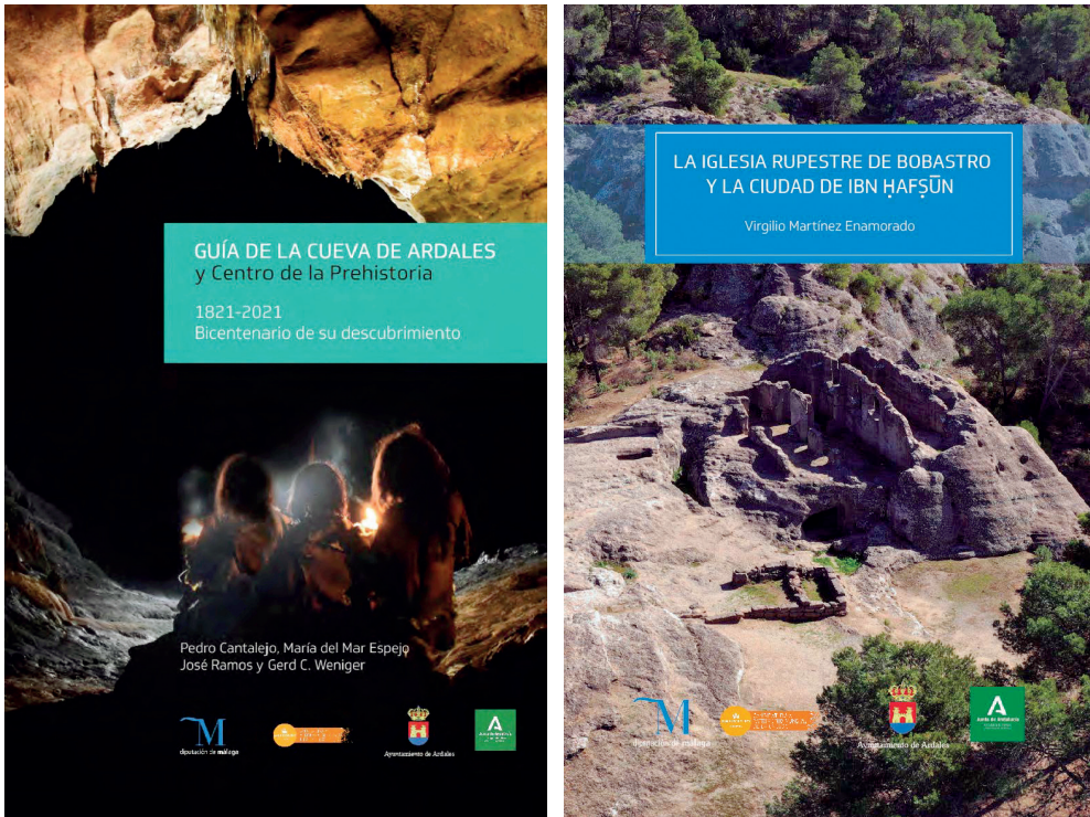
Figuras 8 y 9. Libros editados por la Diputación Provincial sobre Ardales