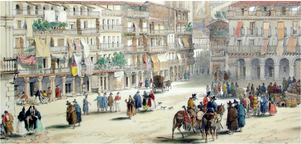
Figura 5. En la imagen se ven en las zonas bajas de la plaza los antiguos soportales donde se hallaban los principales obradores de plateros. Litografía de George Vivian. Año 1838. Procedencia: Spanish Scenery 1838. Litógrafo L. Haghe

En la Plaza de San Francisco encontramos hasta 32 plateros, de ellos 18 maestros: