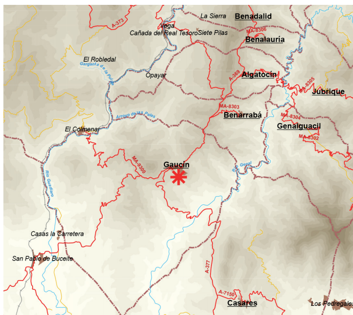
Figura 6. Ubicación de Opayar / Hopallar (¿“Lopallar”?). Instituto Andaluz del Patrimonio Histórico (IAPH): Paisaje de Gaucín (Málaga) [en línea], Sevilla, IAPH. Consulta 28.07.2022:

Con dineros gananciales compró un monte de 150 fanegas de tierra en el territorio de “Lopallar”, donde plantaría a su costa 80.000 cepas de viñas. Una toponimia difícil de rastrear, aunque creemos identificarlo con Hopallar u Opallar, hoy integrado en el término municipal de Benalauria ( vid. figura 6).