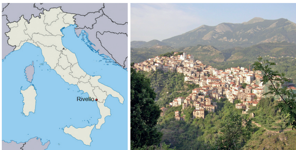
Figuras 3 (izquierda) Localización de Rivello, en la provincia de Potenza, región de la Basilicata (Italia).