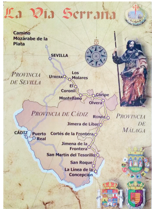
Figura 3. Mapa Vía Serrana

Una muestra son los siguientes, con finalización en la ciudad del Apóstol: