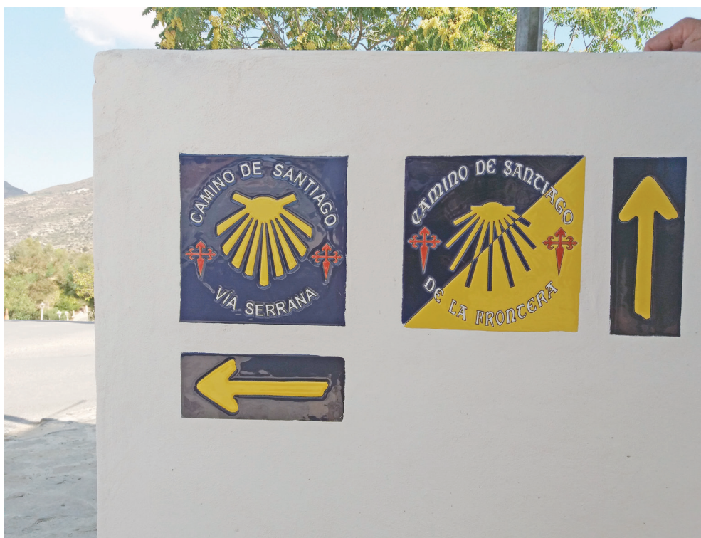
Figura 6. Señalización en Olvera (Cádiz)

caminante con posibilidades de albergue u hospedaje. Estas razones son las que han motivado que la senda transite por el Valle del Guadiaro y las pedanías o estaciones de Gaucín, Cortes de la Frontera, Jimera de Líbar o Benaoján-Montejaque.