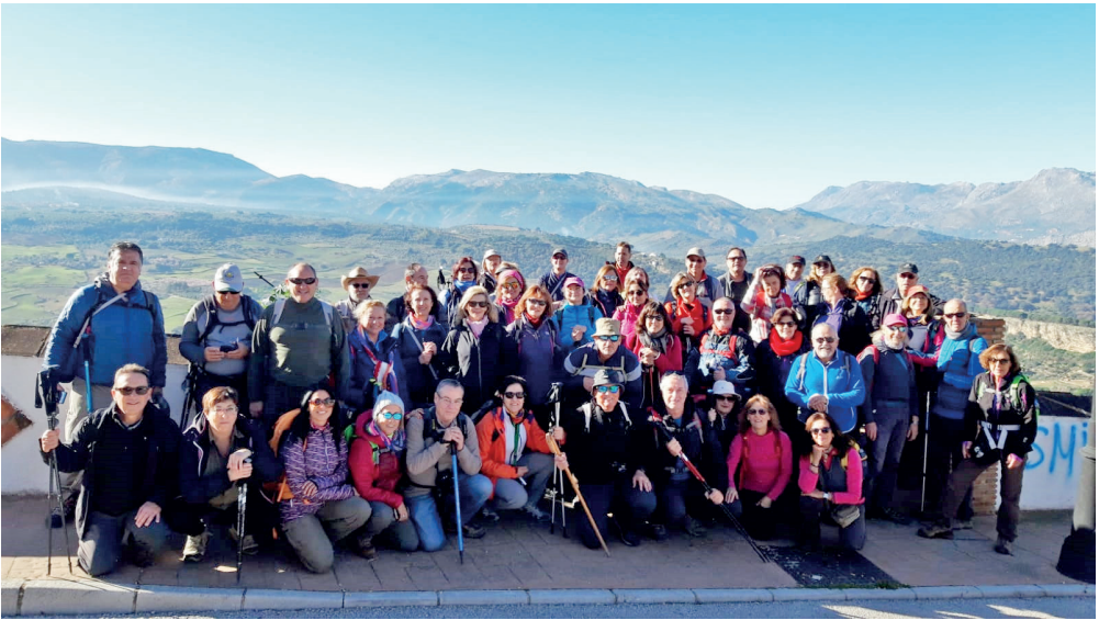
Figura 16. Peregrinos en Ronda (Málaga) iniciando la etapa hacia Setenil de las Bodegas (Cádiz) en febrero de 2019