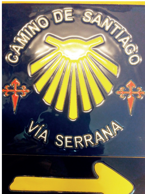
Figura 12. Azulejo y flecha "Vía Serrana"