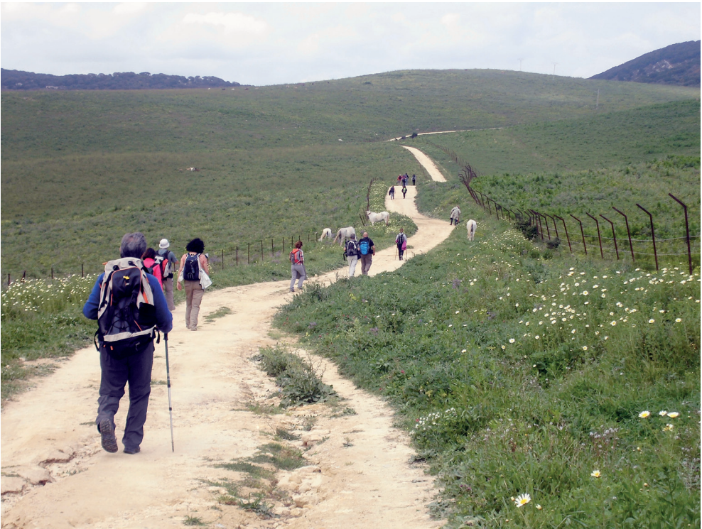
Figura 13. Peregrinos por la Vía Serrana

El ICOMOS ( International Council of Monuments and Sites ) publicó en 1999 la Carta Internacional sobre Turismo Cultural (La gestión del turismo en los sitios con patrimonio significativo) . Este importante documento proporciona aspectos claves de cómo enfocar el patrimonio y su relación con el turismo. Con base en el mismo, cito los siguientes argumentos: