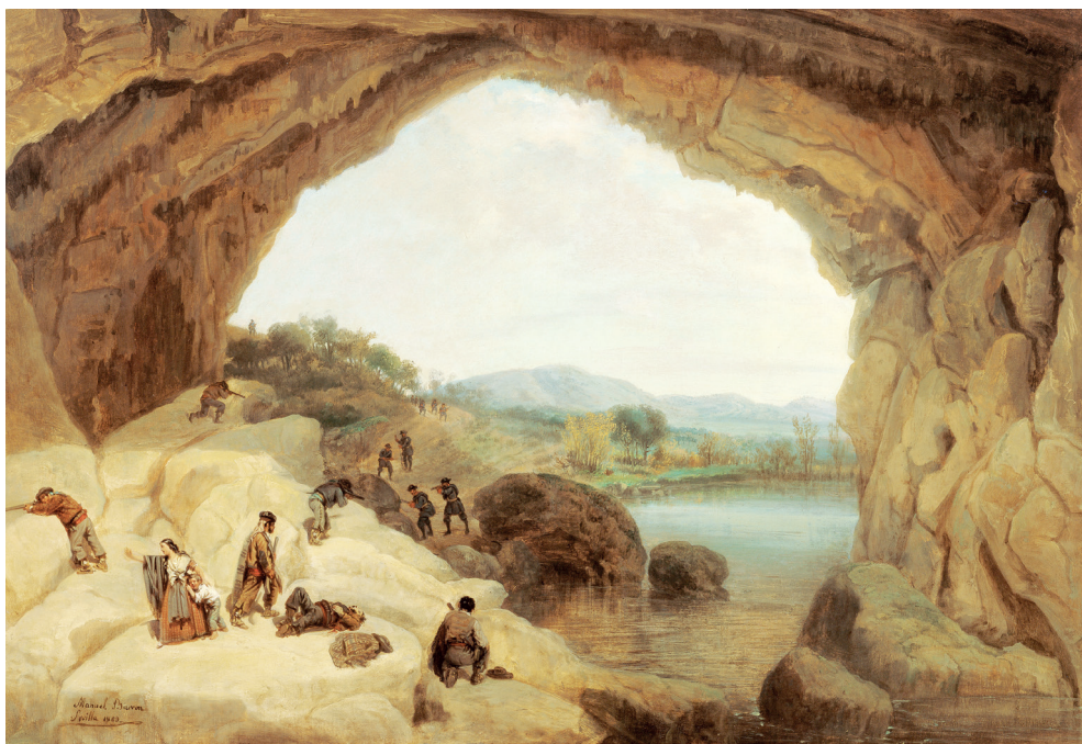
Figura 5. Emboscada a unos bandoleros en la Cueva del Gato (Manuel Barrón y Castillo, 1869). Colección Carmen Thyssen-Bornemisza (Málaga)

No cabe duda del valor añadido que tuvo para la consolidación y uso de estos caminos el estatus de Gibraltar como colonia británica. La guarnición militar y sus funcionarios auspiciaron con sus viajes la difusión internacional de Andalucía, especialmente de la Serranía de Ronda, algo que aún continúa siendo una realidad en el imaginario turístico internacional: el pasado caballeresco fomentado por los romances fronterizos y la literatura; el impacto de la Guerra de Independencia y la victoria sobre el hasta entonces invicto ejército napoleónico; las asperezas del paisaje; el mito del bandolerismo y el contrabandista; el atraso social y cultural del país durante gran parte del siglo XIX y primera mitad del XX. Surgió así un “turismo cultural exotizante”