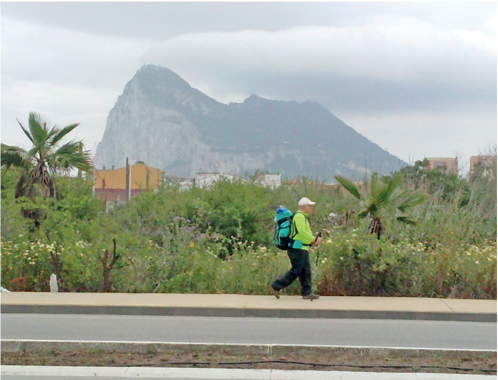
Figura 7. Kilómetro cero: La Línea de la Concepción (Cádiz)

pequeña densidad poblacional, lo que permite considerar esta ruta dentro del llamado “turismo slow ” o slow travel , una forma de viajar que ofrece al caminante experimentar y vivir de cerca ámbitos rurales poco transitados y con una fuerte personalidad comarcal, pues se trata de un espacio que se podría definir como “área cultural de rasgos compartidos”. Como excepciones a esta baja densidad de las poblaciones de paso estarían únicamente el punto de partida, La Línea de la Concepción (Cádiz) con 63.000 hab.; el intermedio, Ronda (Málaga), con 34.000; y el destino final, Utrera (Sevilla), con 52.000. Este aspecto enlaza con el concepto de “turismo cultural” antes aludido, surgido a finales del XIX y comienzos del XX, cuando aún no estaba en auge el de sol y playa, y con el de “turismo de interior”.