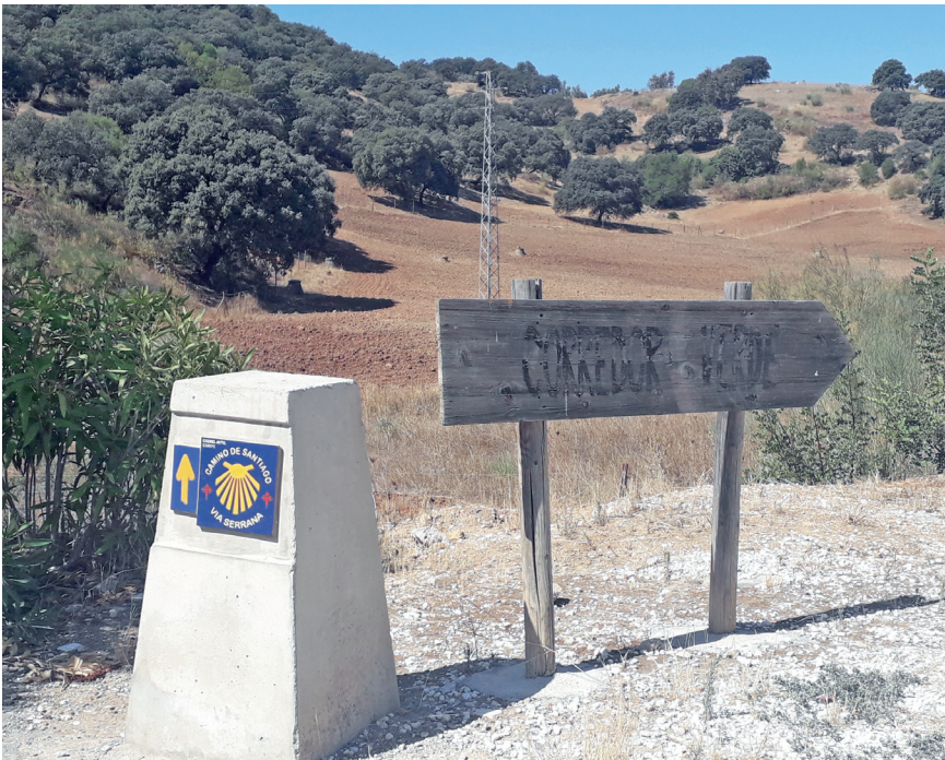
Figura 11. Señalización en Coripe (Sevilla)