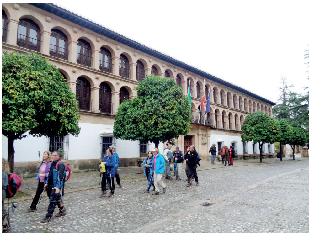
Figura 15. Peregrinos gaditanos en visita al Ayuntamiento de Ronda (2014)

Para un caminante–peregrino entrar en la ciudad de Ronda a pie por la citada puerta del Almocábar y contemplar su patrimonio monumental resulta una experiencia inolvidable, única, que le devuelve las fuerzas perdidas tras la penosa subida desde el valle del Guadiaro. El trazado de esta senda ha sido diseñado por el centro histórico de la población. Así, a medida que avanza sobre sus pasos, mochila al hombro y bordón en mano, descubre rincones que posiblemente visita por vez primera.