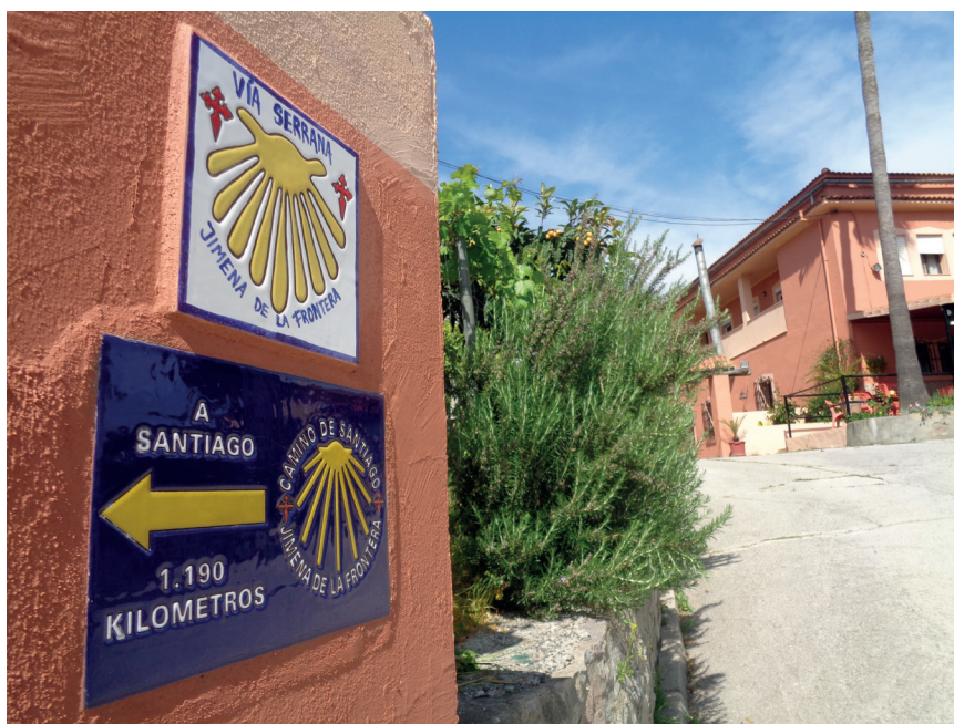
Figura 8. Señalización en Jimena de la Frontera (Cádiz)