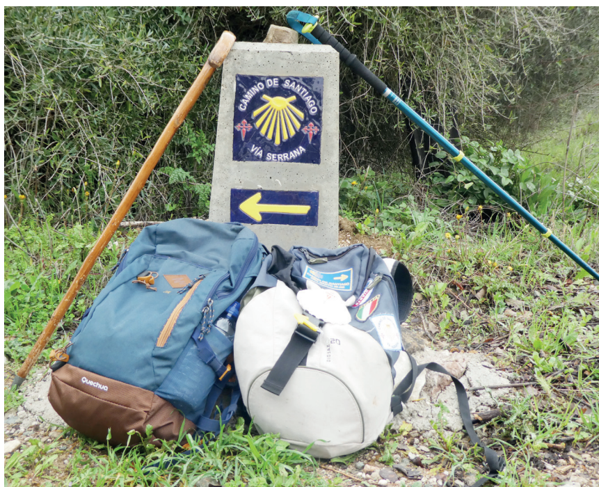
Figura 9. Señalización en Cañada del Real Tesoro (Cortes de la Frontera, Málaga)