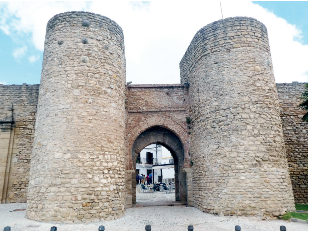
Figura 14. Ronda (Málaga), Puerta del Almocábar

El viajero cuando traspasa la Puerta del Almocábar puede dirigirse hacia la iglesia del Espíritu Santo, la iglesia-Convento de Santa Isabel, el ayuntamiento con su