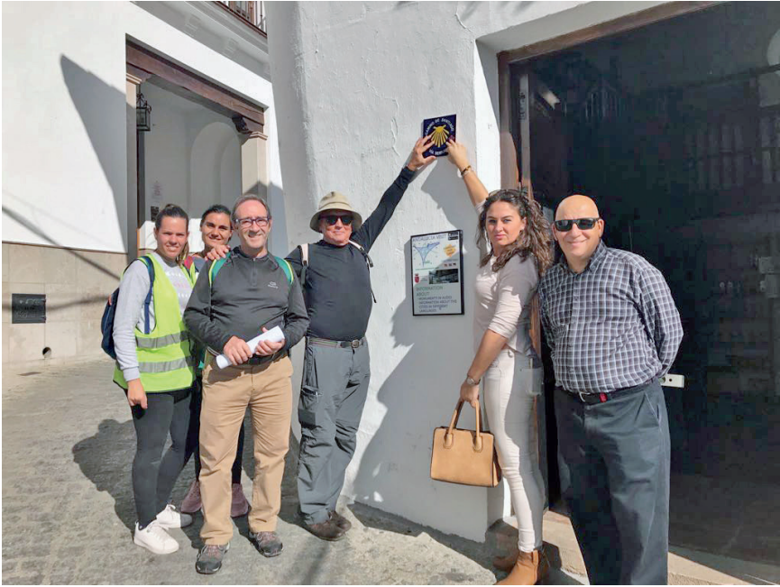
Figura 10. Señalización en Setenil de las Bodegas (Cádiz)