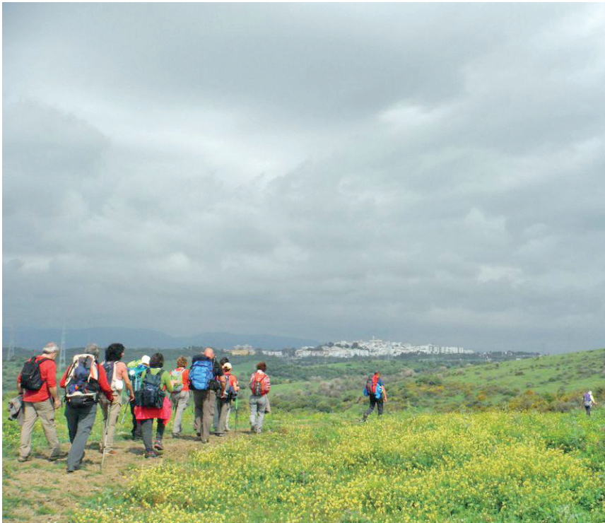
Figura 1. 1.ª Etapa: La Línea de la Concepción-San Roque (Cádiz)

KEY WORDS: Jacobean way “Vía Serrana”, english way, culture, heritage, slow travel.