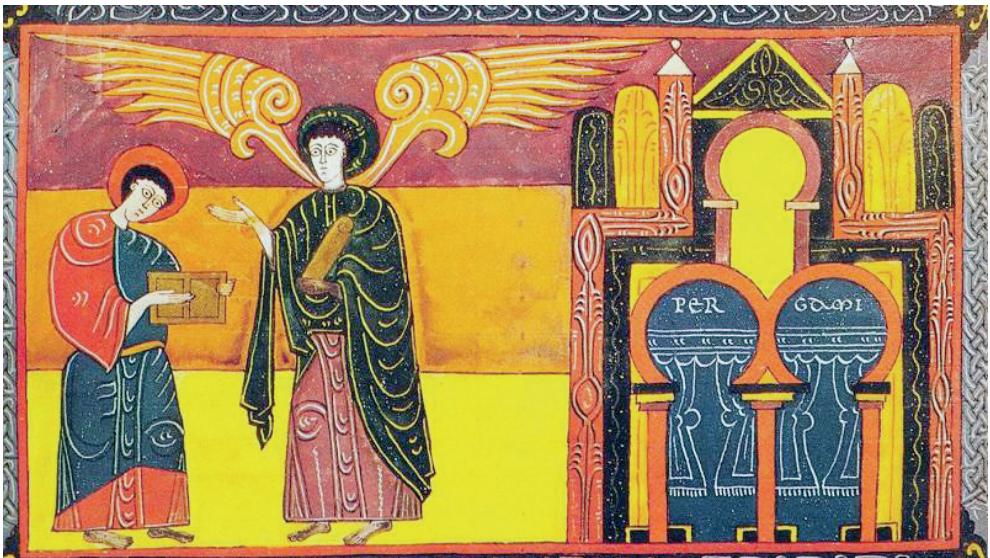
Figura 2. Mozárabes. Miniaturas del Códice del Beato de Liébana, Comentarios al Apocalipsis de San Juan (siglo VIII)

Pero hubo unas primeras peregrinaciones anteriores a la jacobea. El destino era también Mérida, atraídos los primeros cristianos por la figura de la mártir Eulalia o