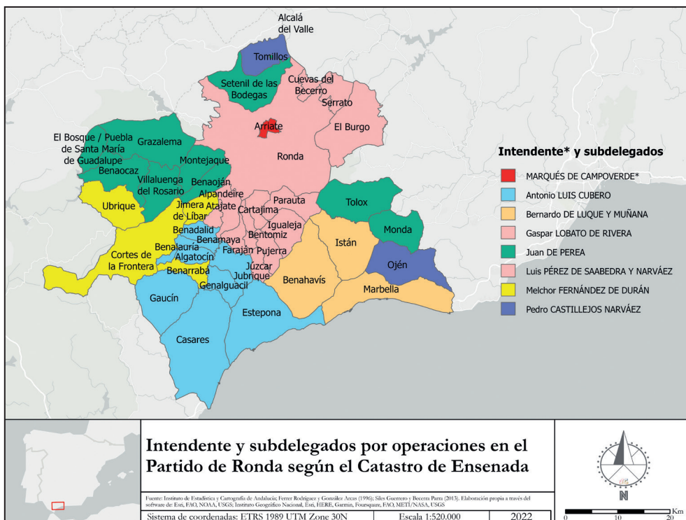
Figura 3. Intendente y subdelegados por operaciones en el Partido de Ronda