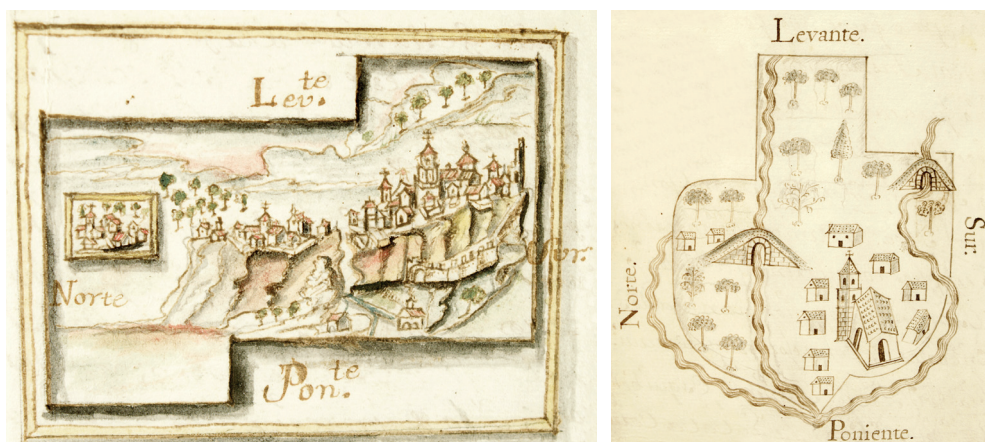
Figura 2. Representación de Ronda y Arriate en el Catastro de Ensenada