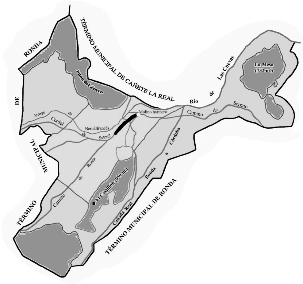
Figura 3. Mapa que sitúa las 14 caballerías que recibió Alonso Yáñez Fajardo en Cuevas del Becerro.