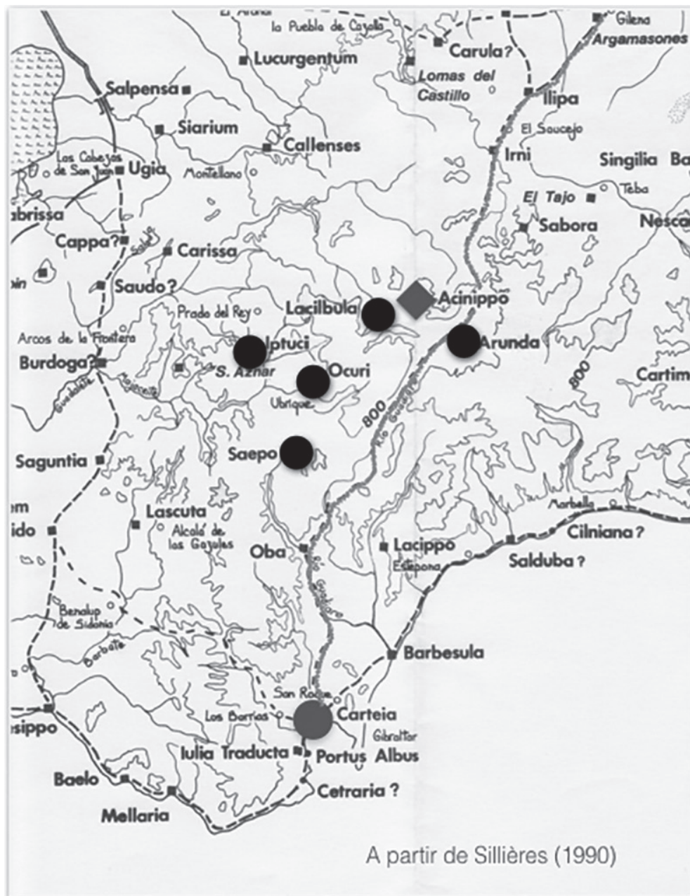
Fig. 5. Acinipo y su conexión con la vía Carteia-Corduba