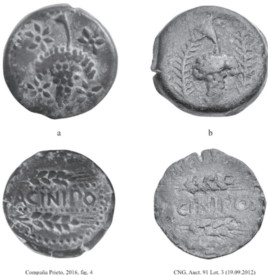
Figura 3. Un nuevo tipo de Acinipo y su posible paralelo en la ceca

Ciertamente sobresale el vacío de amonedaciones propias en esta comarca que ocupa una posición intermedia, pero también estratégica, entre la costa mediterránea y el valle del Baetis , en cuyo entorno se concentran la mayor parte de estas cecas locales. Lacibula , Arunda , Sabora o Saepo son, entre otros, cercanos enclaves a Acinipo que no cuentan con moneda propia, mientras que otros como Ocuri lo hacen de manera anecdótica (Fig. 5), o en todo caso parecen tener una incidencia escasa en la circulación monetaria de la Mesa de Ronda, como sucede con Lacipo o la más distante, pero de mayor producción Carissa (Arévalo, 2005, pp. 59-60).